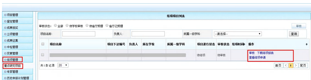
<管理员审核示意图>

管理员登录后，目前只限超级管理员，点击【教育厅业务】à 结项管理，在列表中审核结项信息。高校审核通过的结项申请会被递交到省厅管理员页面。